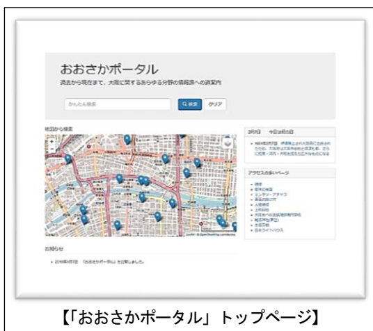
【「おおさかポータル」トップページ】

30年度に構築した「おおさかポータル」が情報発信の拠点となるよう、府域図書館、大学、研究機関等とのデータベース連携の拡充を図り、情報社会の進展とともにますます高度化する利用者のニーズに応えていきたいと考えています。