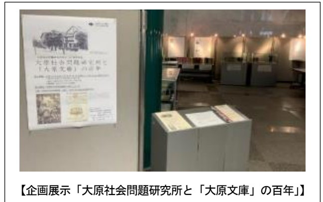
【企画展示「大原社会問題研究所と「大原文庫」の百年」】

障がい者サービスでは、平成 28 年 4 月 1 日施行の障害者差別解消法に対応するべく、府域図書館への研修を積極的に実施しました。また、国立国会図書館視覚障害者等用データ送信サービスへのデータ提供数を着実に増やし、当館提供コンテンツの利用数も大きく増加しました。DAISY をはじめとしたデジタル資料の活用に関する法制度が整備されつつある状況に合わせて、読書に支援が必要な方へのサービスが適切に提供できるよう、今後とも努めていきます。