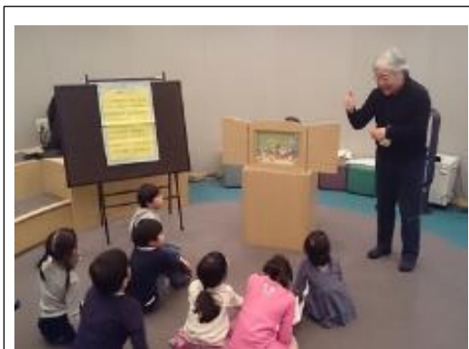
【手話を用いたおはなし会「楽しい手話」】

24 年度から府立図書館の職員が講師を務めている「子どもの読書活動推進支援員養成講座（派遣）」は、第三期中にすべての図書館未設置自治体で開催することができました。