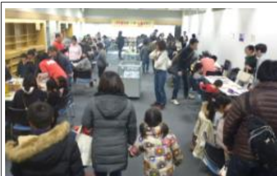
【(中央図書館) 図書館でボードゲームをする日】

これまで図書館利用者からは高い満足度が得られている一方、入館者数は減少傾向にあり、新規利用者の獲得が課題となっています。その第一歩として、図書館に来館してもらう機会を創り出すことが必要です。中央図書館では第三期に続き、外部機関との連携による生涯学習事業の拡充を第四期の重点目標とします。中之島図書館では、第四期に向けては「大阪の歴史と商い」を基本コンセプトとして、指定管理者との連携を今後一層強化し、多彩な事業展開を通じて、大阪の「魅力」についての情報発信に努めます。