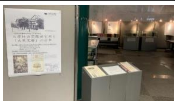
【企画展示「大原社会問題研究所と「大原文庫」の百年」】

障がい者サービスでは、平成 28 年 4 月 1 日施行の障害者差別解消法に対応するべく、府域図書館への研修を積極的に実施しました。また、国立国会図書館視覚障害者等用データ送信サービスへのデータ提供数を着実に増やし、当館提供コンテンツの利用数も大きく増加しました。DAISY をはじめとしたデジタル資料の活用に関する法制度が整備されつつある状況に合わせて、読書に支援が必要な方へのサービスが適切に提供できるよう、今後とも努めていきます。