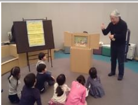
【手話を用いたおはなし会「楽しい手話」】

こども資料室では外国語資料の定期的なミニ展示や多国語によるおはなし会、手話を用いたおはなし会「楽しい手話」、「こども向け調査ガイド」の拡充など児童サービスに関する様々な取組を実施し、その成果を実習、研修等で府域の児童サービス担当者等に提供しました。