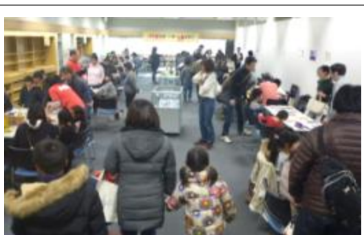
【(中央図書館) 図書館でボードゲームをする日】

府立図書館は、府民に開かれた図書館として、地域の魅力に出会う「場」と機会を提供します。