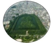
(仁徳天皇陵古墳)

新しい令和の時代を迎え、改めて自国の歴史を振り返り、遺された歴史文化資源の価値、その意味を探ります。